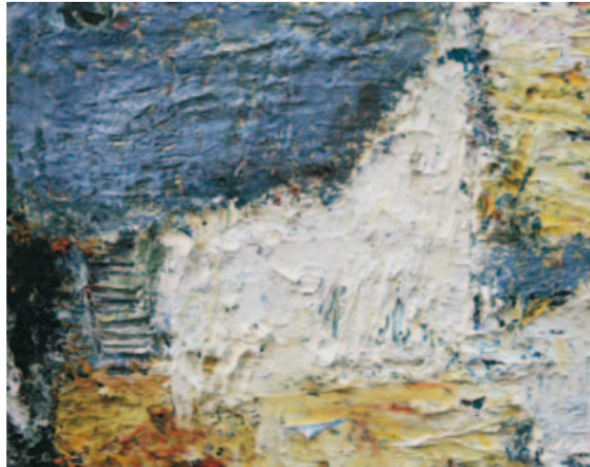
White Chapel | 2010