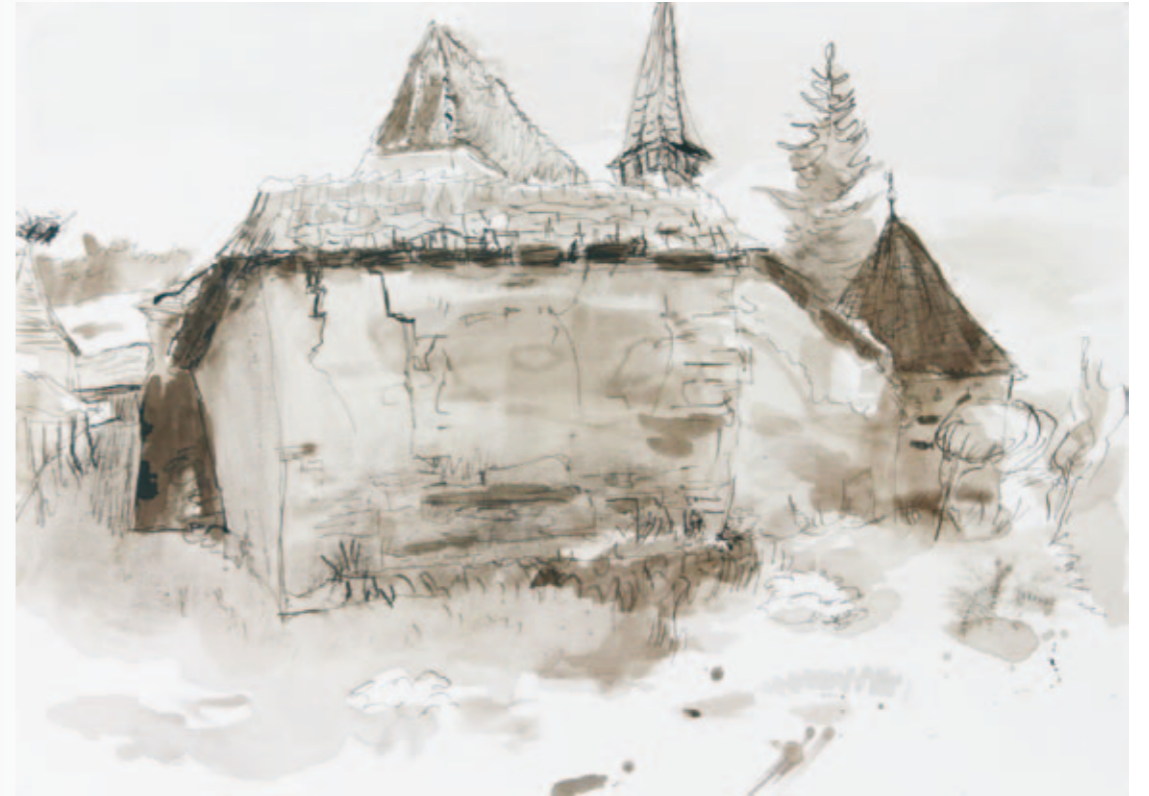
Kirche von Arkeden | 2008