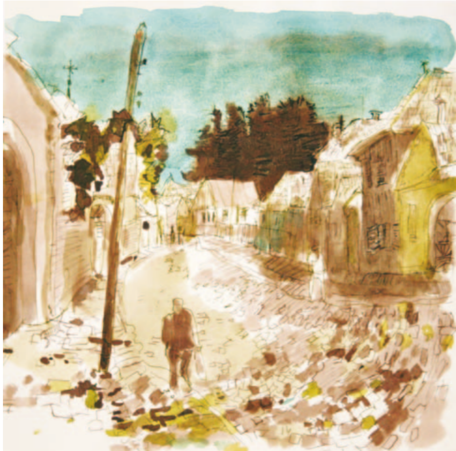
Straße in Rasinari | 2008