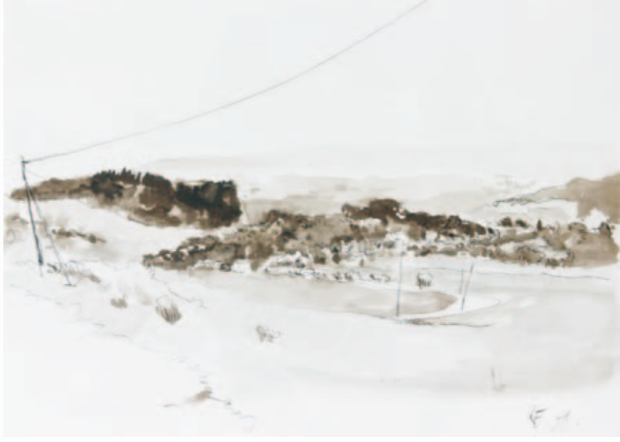
Leblang | 2008