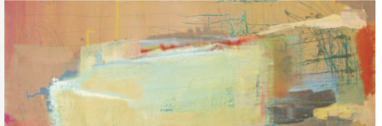
Sonntag in Cádiz | 2008