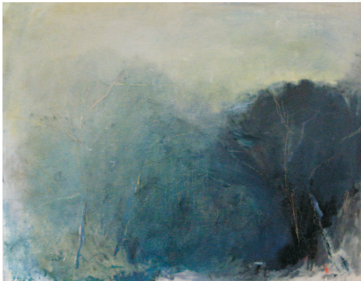
Heimkehr bei Einbruch der Dämmerung | 2006