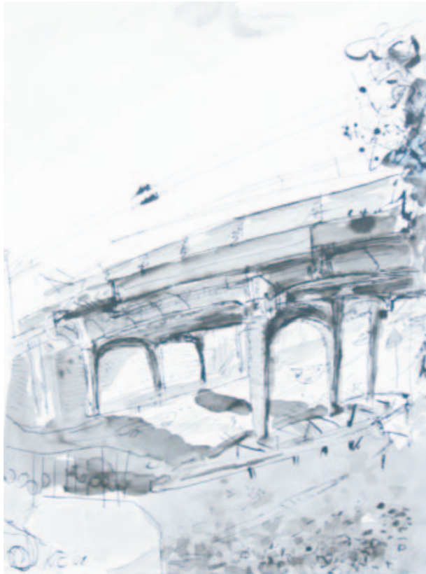
S-Bahnbrücke Lützner Straße | 2010