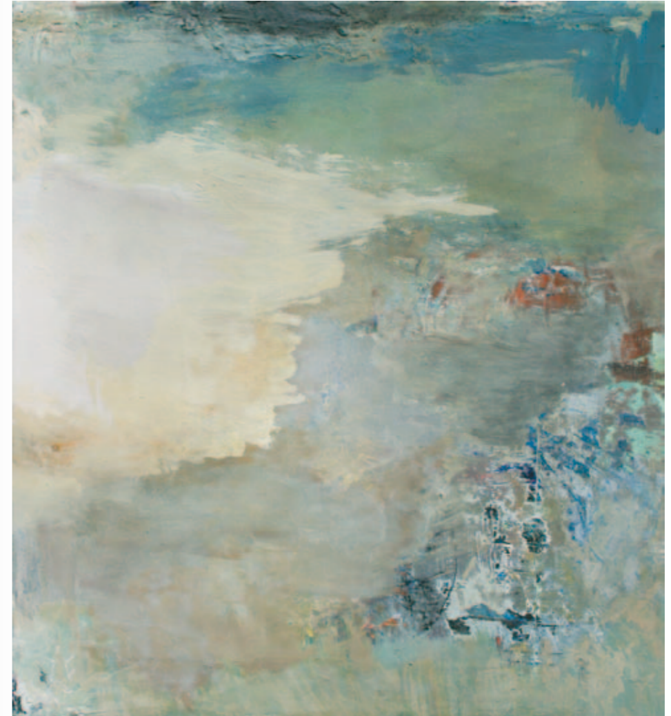
Balea Lac | 2011