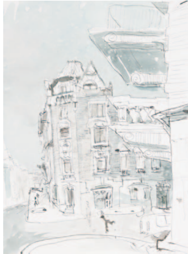
Eckhaus | 2010