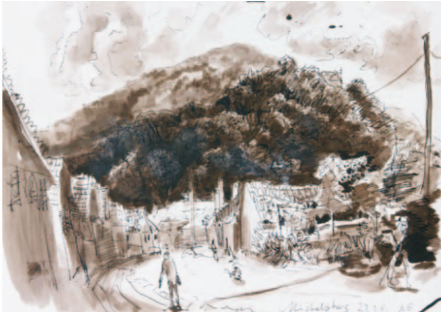
Michelsberg | 2008