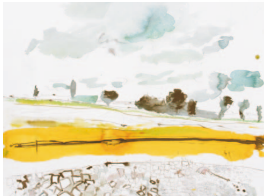
Landschaft bei Nienburg | 2012