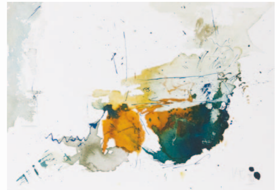
Hünengrab | 2012