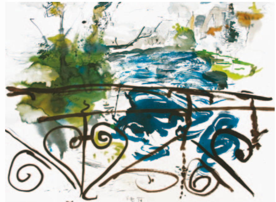
Bode | 2012