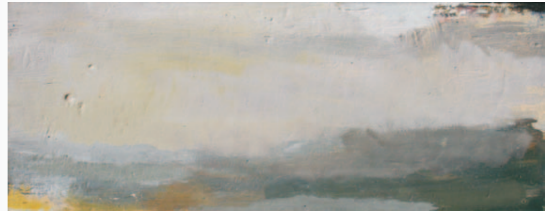
Ferne II | 2011