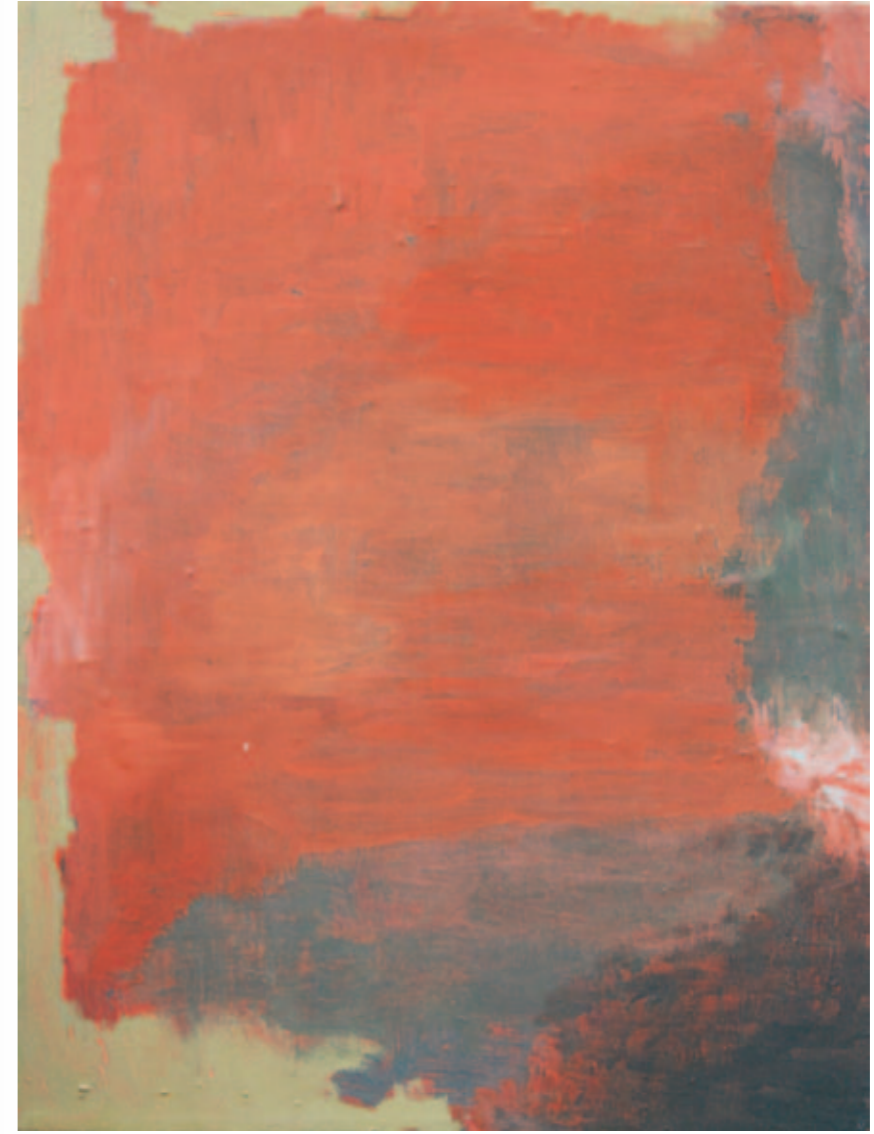
Der Weg führt in den Wald hinein | 2005