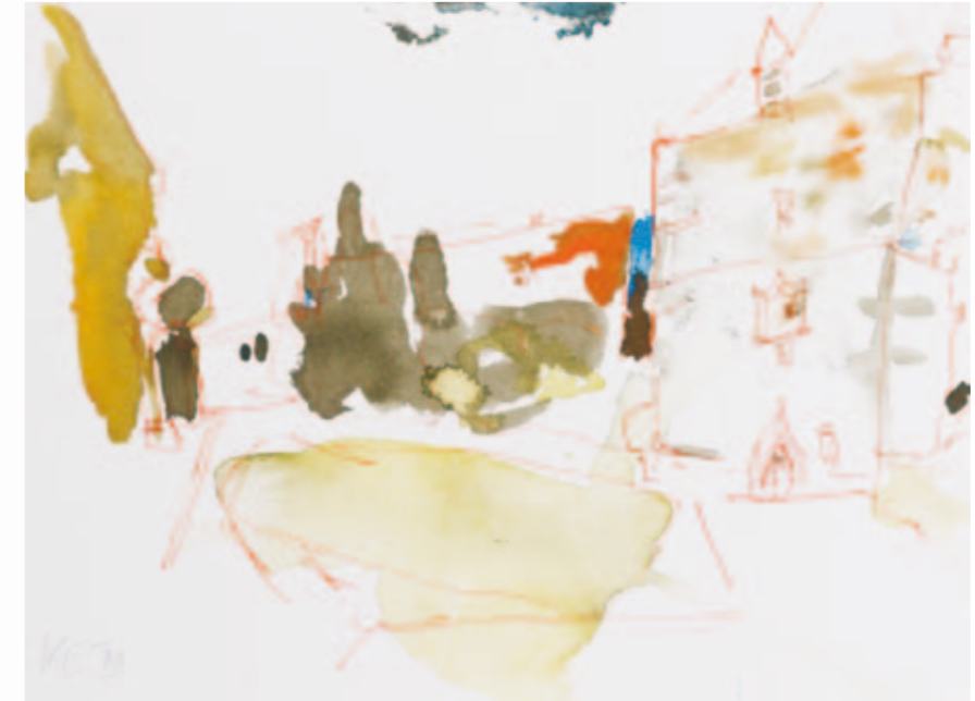
St. Marien und St. Cyprian | 2012