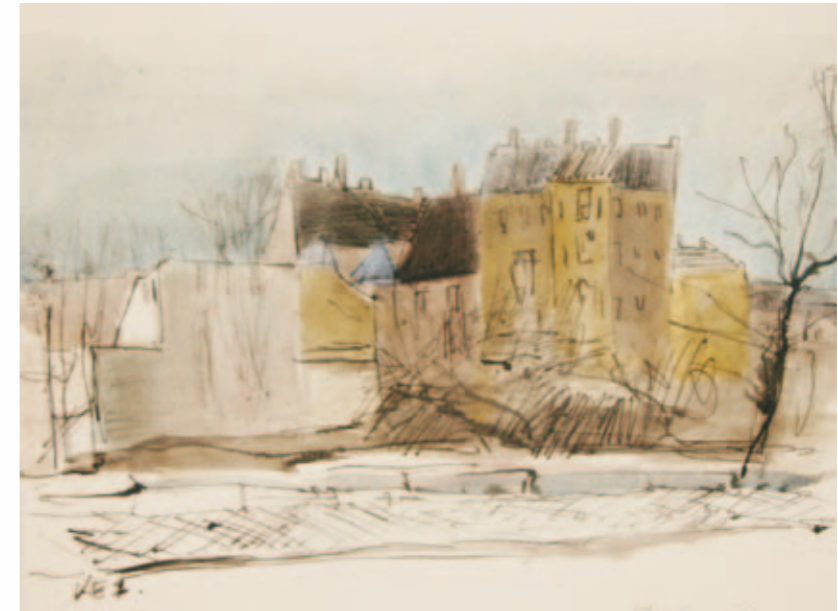
Rückansicht Lindenauer Markt | 2010