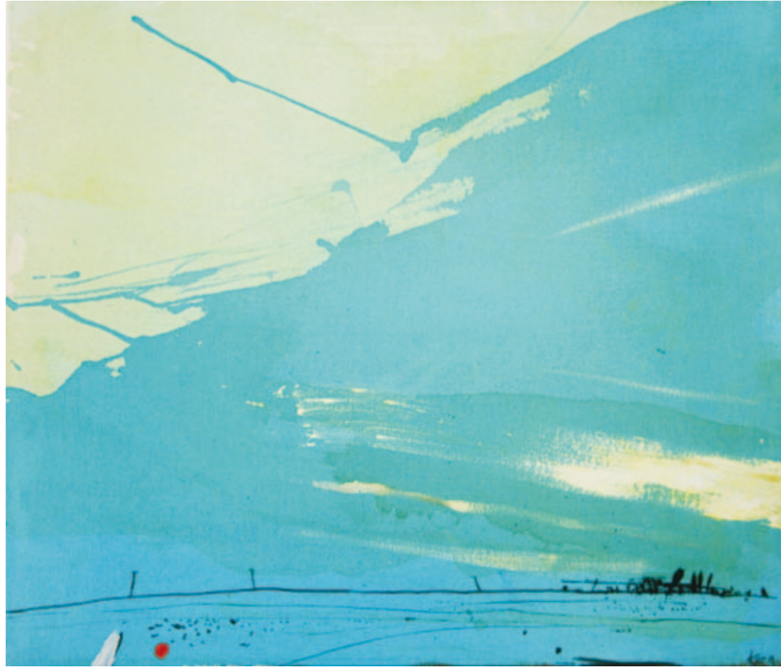
übers Land | 2010