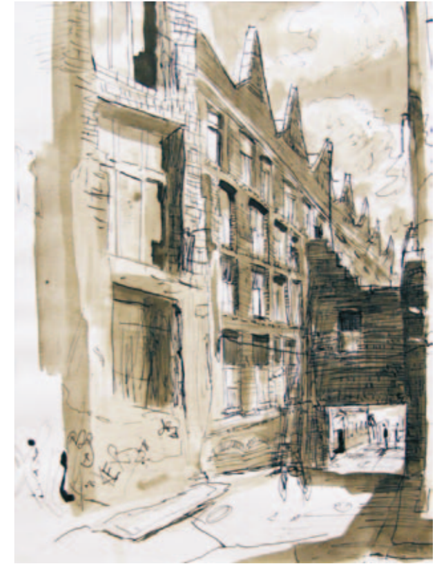
Fabrikdurchfahrt | 2009