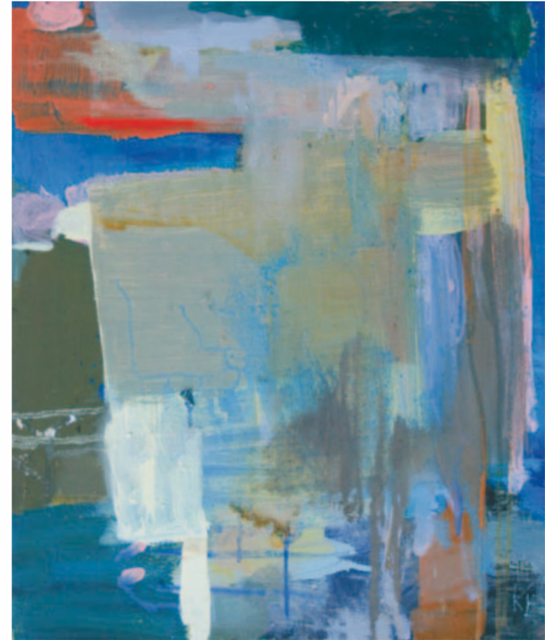
rosa | 2011