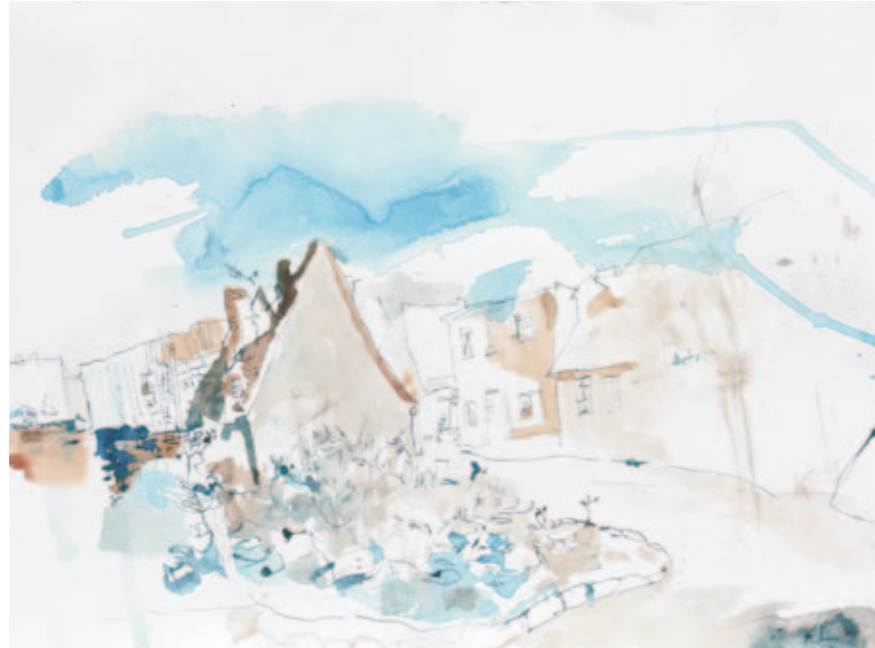
Häuser in der Talstadt | 2012