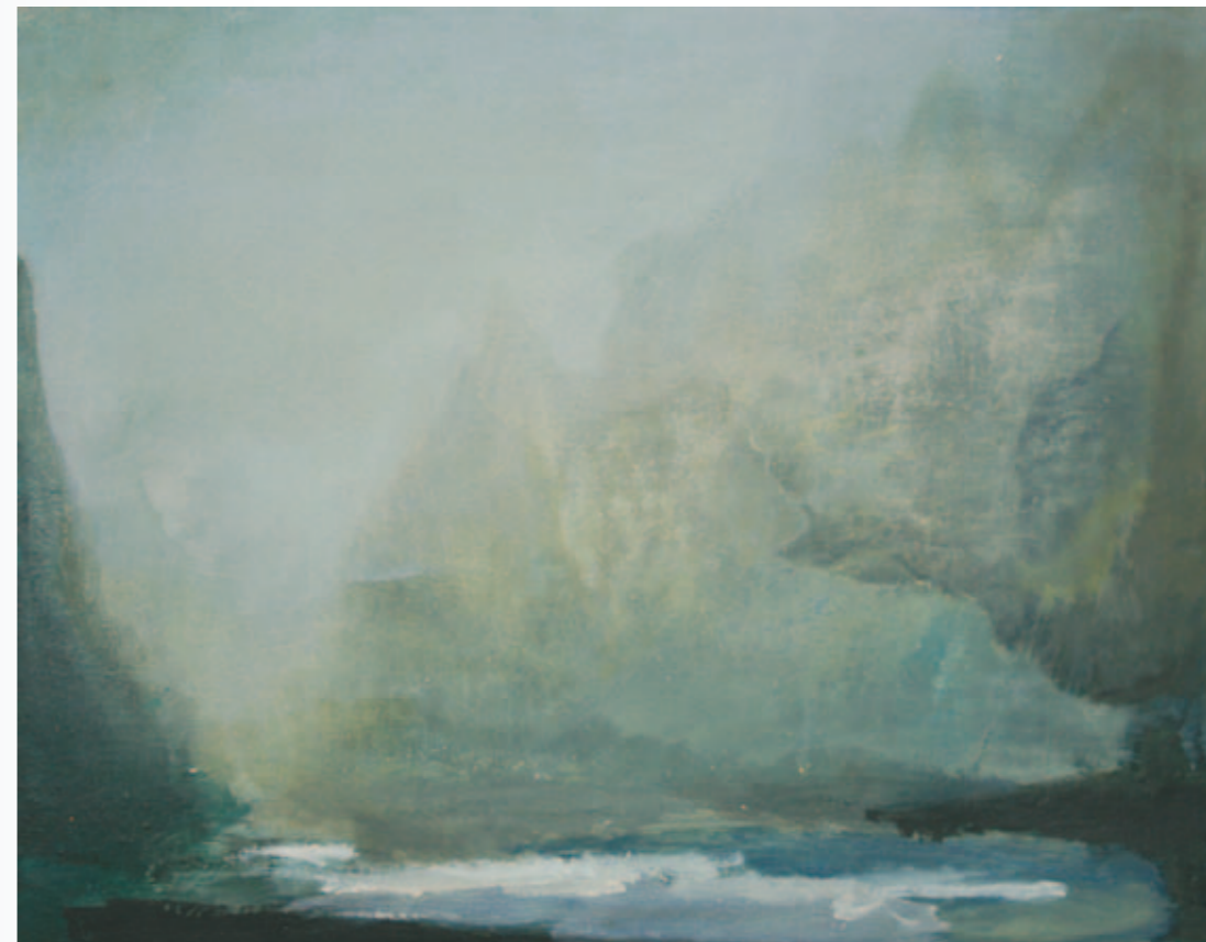
Asturische Bucht | 2009