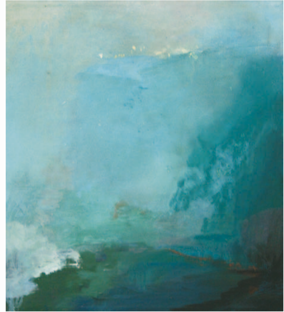
Dorf in den Bergen | 2009