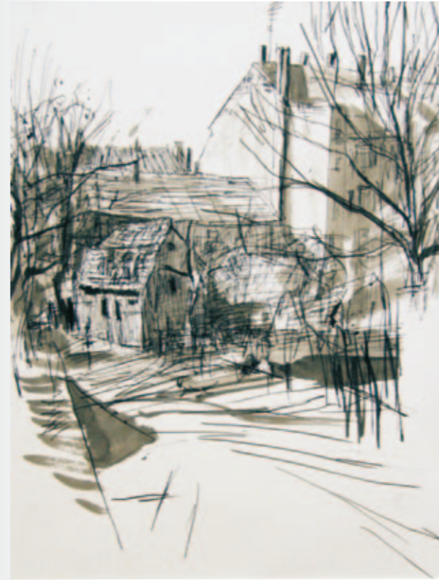
Kleines Haus in der Apostelstraße | 2010