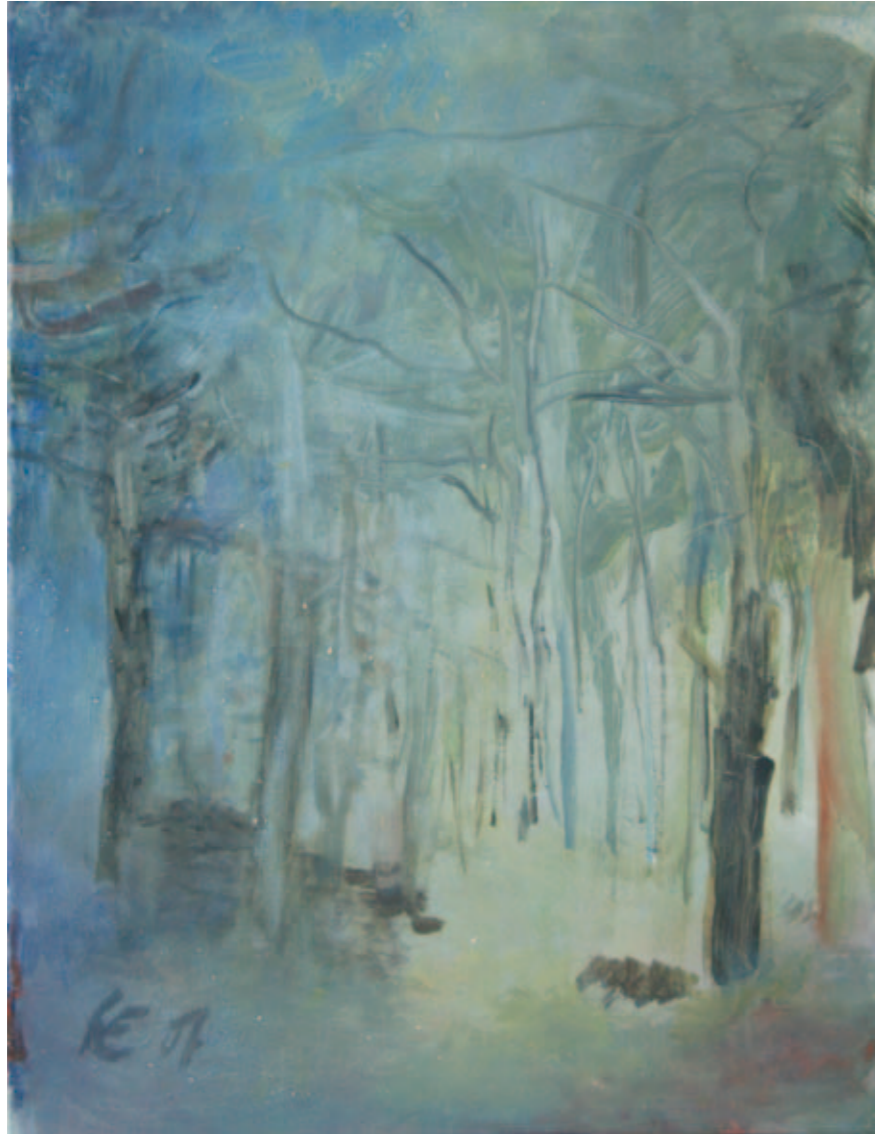
Park I | 2007