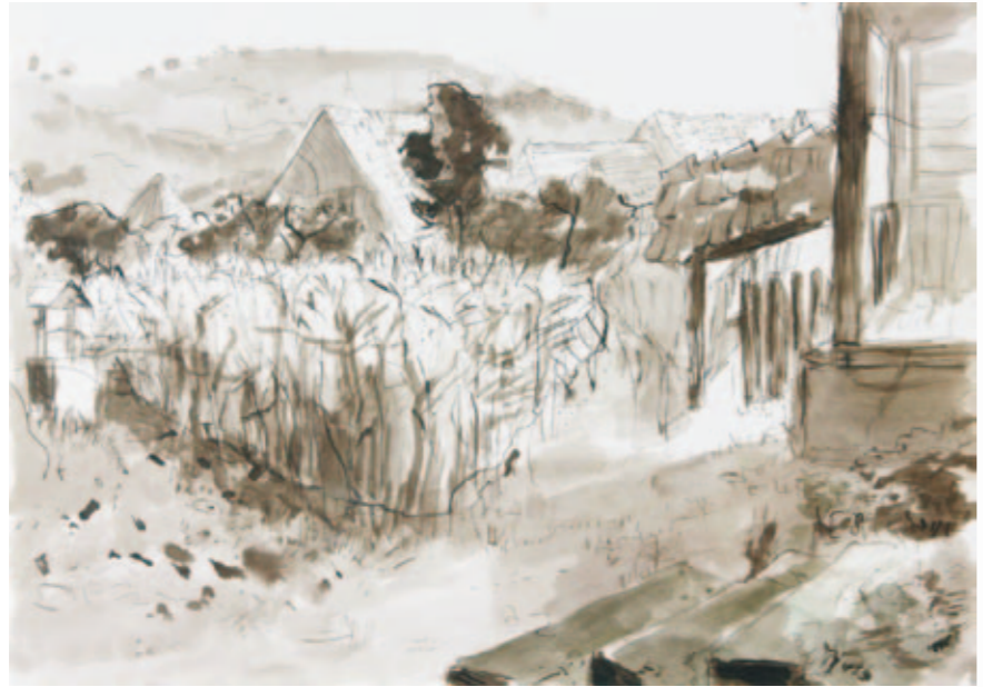
Maisfeld | 2008