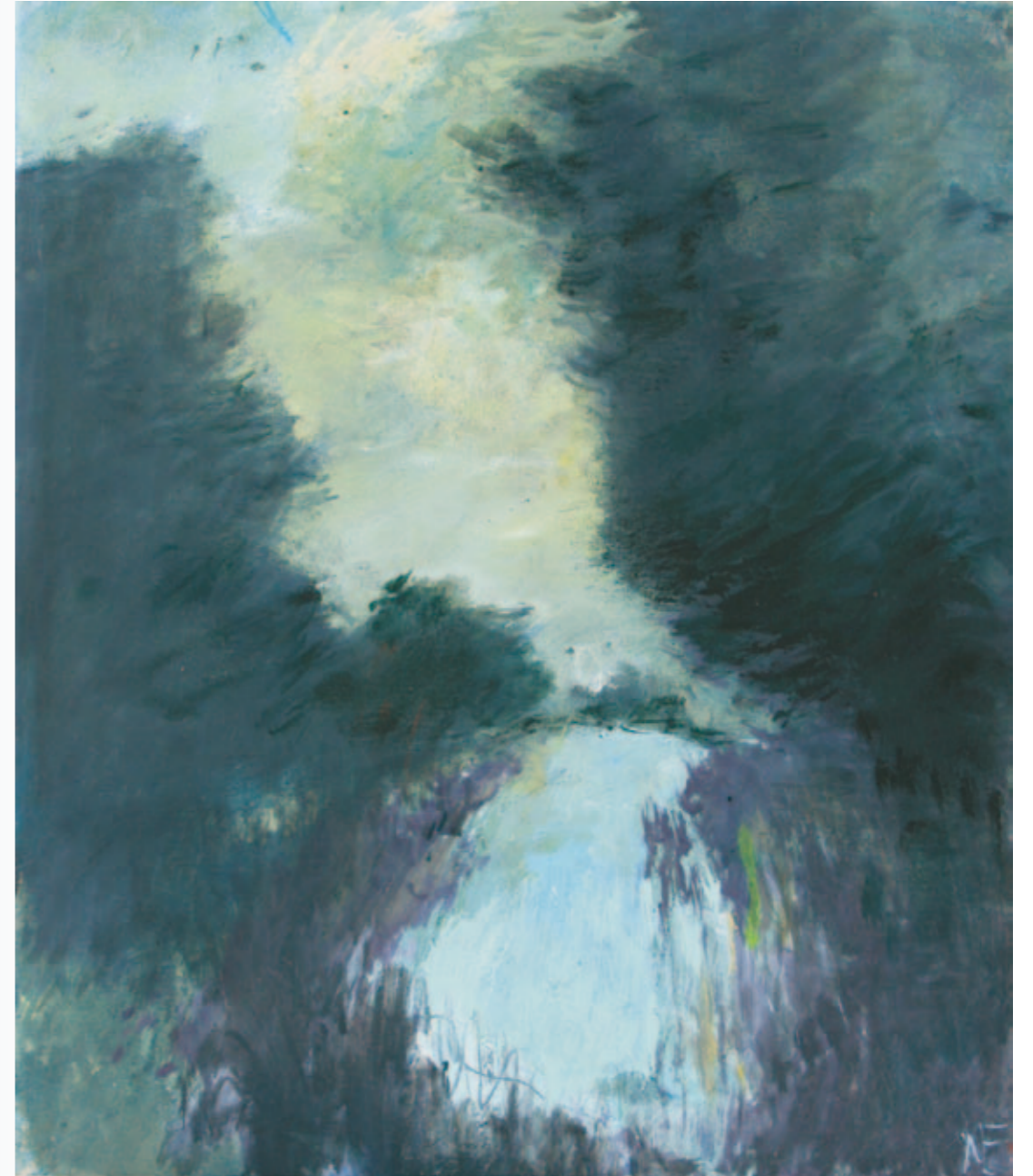
Wildenhain | 2010