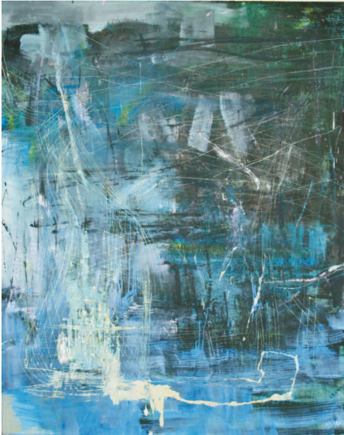
Pronto | 2008