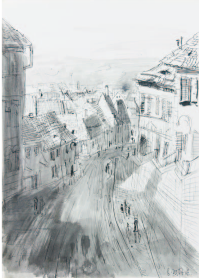
Auf der Lügenbrücke in Hermannstadt | 2007