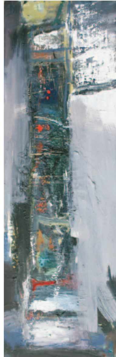
Gotisches Viertel | 2010