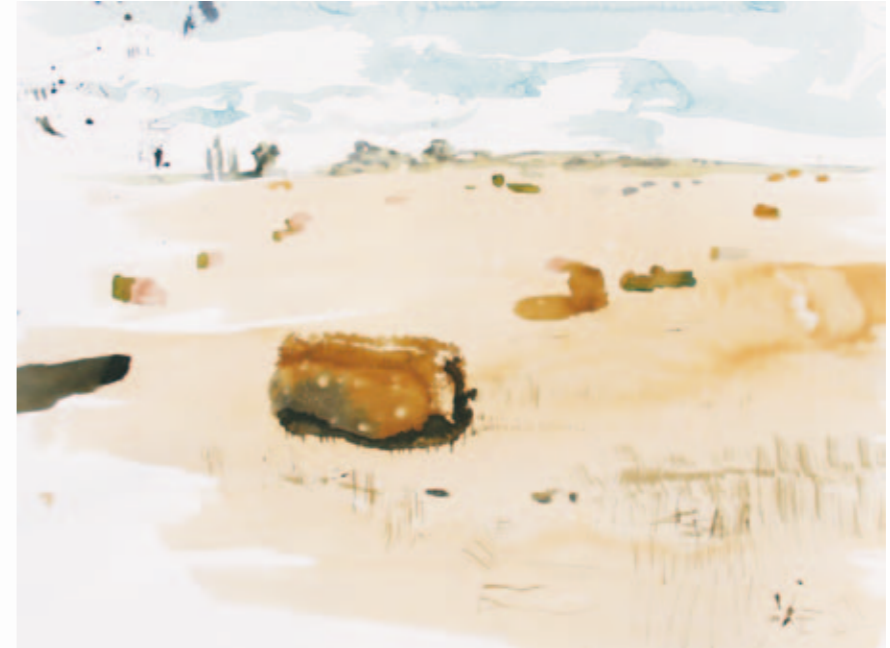
Strohballen | 2012