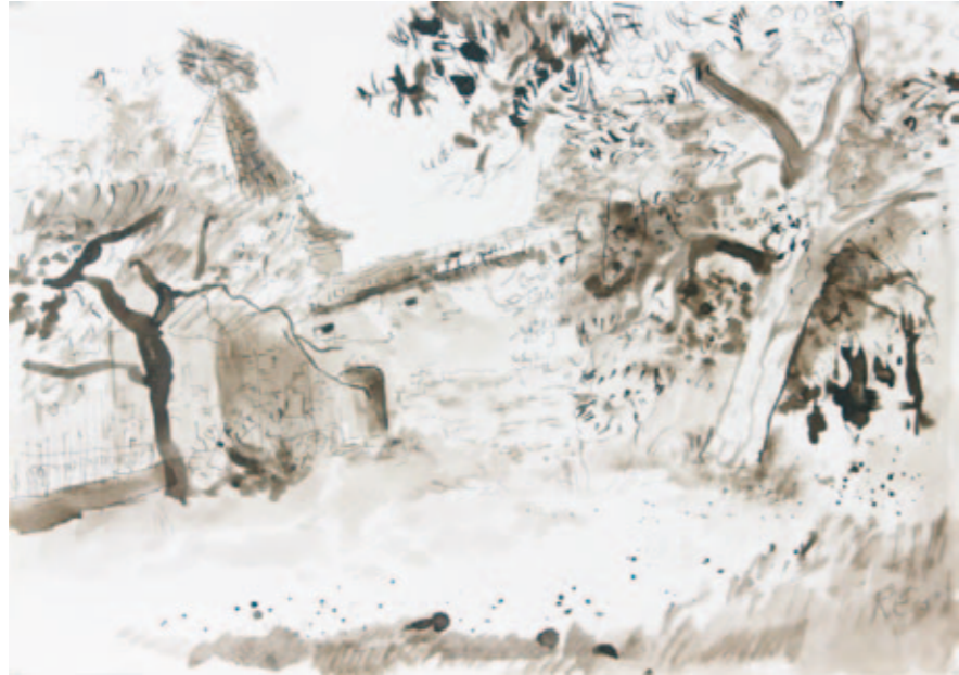
Garten | 2008