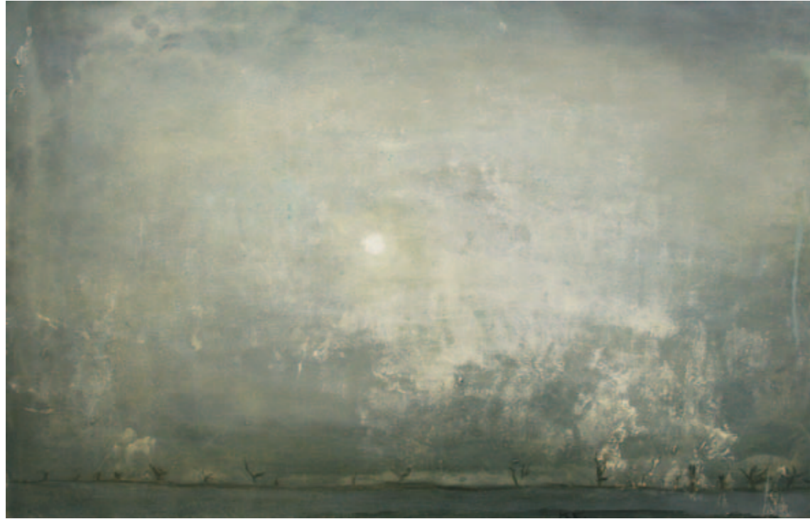
Mondschein | 2010