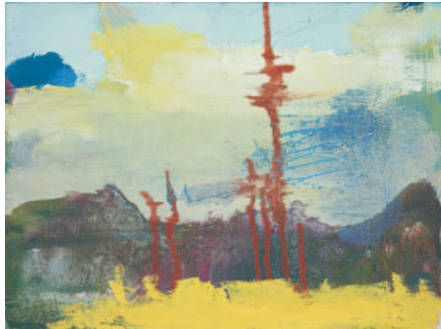
Poletnik | 2007