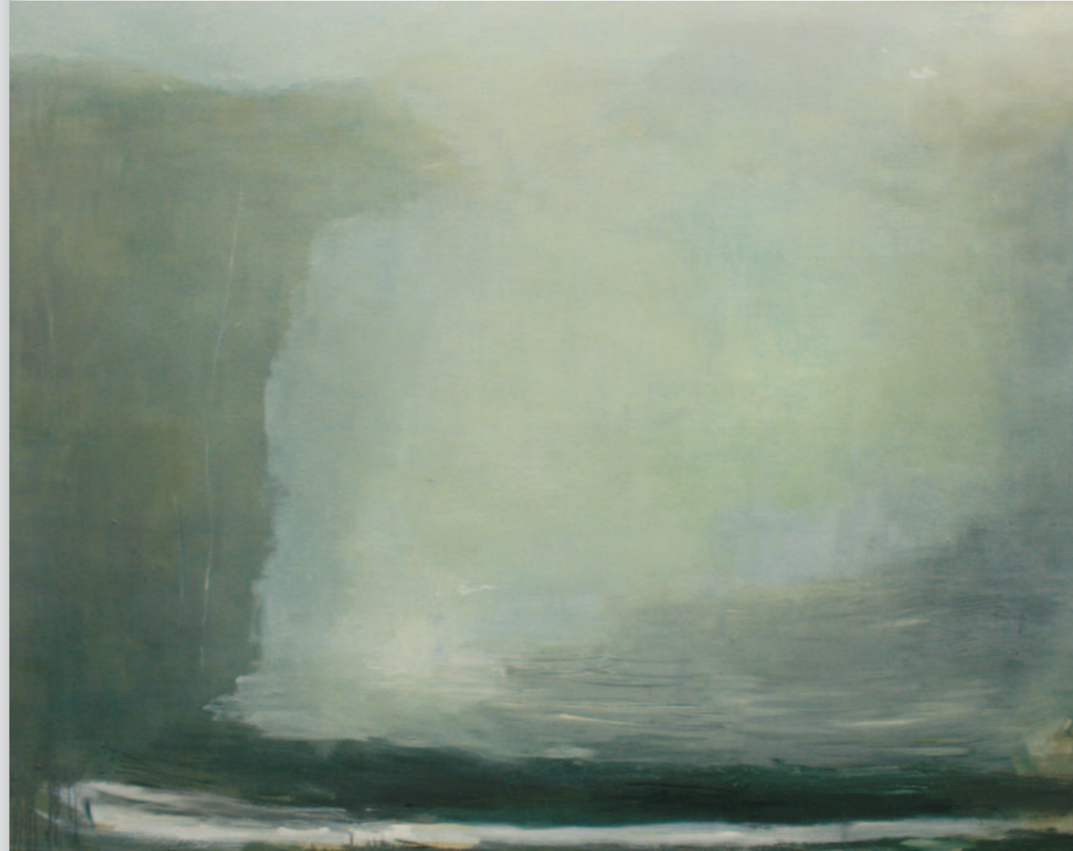
Stechlin | 2010