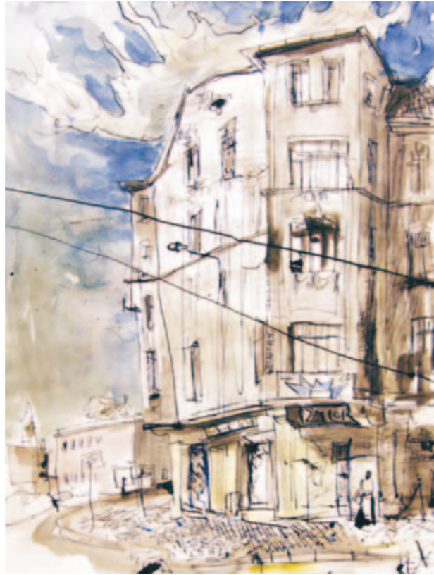
Spielothek im Kopfbau | 2010