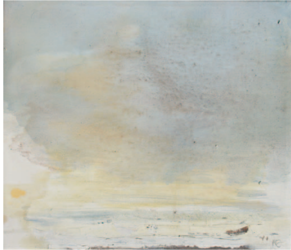
Ferne I | 2011